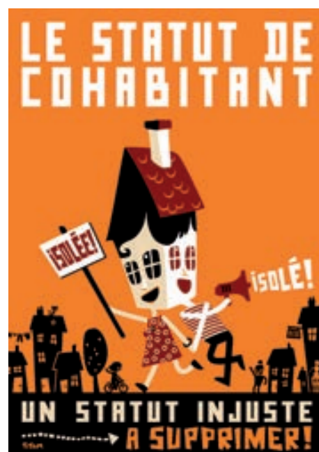
Illustration de Titom, mise à disposition selon la licence Creative Commons by-nc-nd 2.0 www.titom.be

N'hésitez pas à consulter le site et la revue du Collectif Solidarité Contre l'Exclusion : www.ensemble.be ■