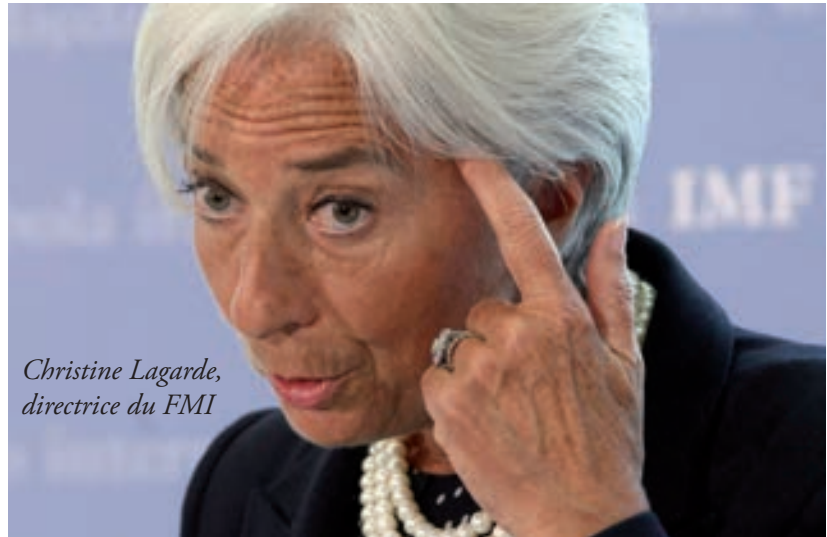
Christine Lagarde, directrice du FMI

Deux études du Fonds monétaire international prennent le contre-pied de la doctrine économique appliquée jusqu'ici en Europe et en Belgique en particulier et viennent confirmer les positions syndicales développées dans le dernier Baromètre socio-économique de la FGTB. Il en ressort que la dérégulation du marché du travail en fin de compte n'apporte aucun bénéfice à l'économie et finit même par nuire à la productivité.