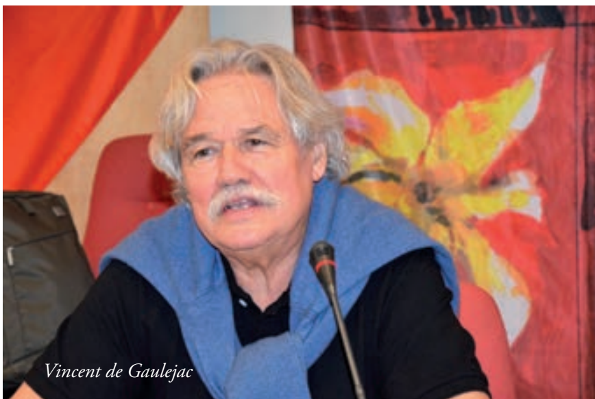
Vincent de Gaulejac

Sur ce sujet du mal-être au travail, les syndicats sont dans une posture difficile. Les militants doivent produire une alternative mais la culture syndicale les a habitués à lutter pour des revendications matérielles ! Face à cette évolution d'une conflictualité sociale vers une conflictualité psychique, les travailleurs veulent avant tout autre chose être écoutés. Broyés par une bureaucratisation néolibérale – c'est ainsi que Béatrice Hibou nomme le capitalisme managérial – les travailleurs des services publics sont soumis, autant que leurs collègues du privé, à une forme de liberté contrôlée. Les objectifs de performance remplacent ainsi le contremaître d'antan. Cette universalisation, cette indifférenciation entre le public et le privé traduit l'exercice d'une certaine domination. Comme Vincent de Gaulejac le soulignait, ce mode de domination n'est plus imposé d'en haut, mais il est le fruit de la rencontre d'intérêts. En somme, ce nouvel esprit du capitalisme récupère l'idéal de la liberté et induit une dépolitisation somme toute très politique et la psyché des travailleurs est